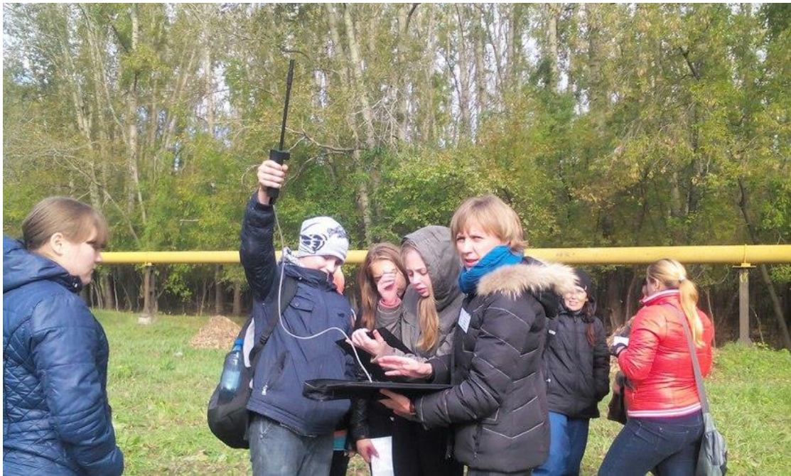
Рис.3. Покорение вершин метеорологии

Держа в руках столь хрупкий инструмент, Стоял я затаив дыханье... О, как же здоров был тот момент, Какие славные о нём воспоминанья... Я буду помнить это навсегда, Наш день, что собрал всех вместе. И пусть летят года, Но не забудем мы весь этот день чудесный.