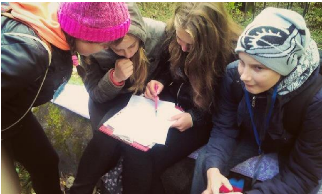
Рис. 2. Знатоки Томской области форсируют кроссворд.

Мы знатоки родного края те ещё, За это нас простите вы, конечно. Ведь мы изучили уже всё, Ведь любим мы конечно, Томск сердечно. Спасибо вам за то, что дали осознать, Что надо знать природу края, Ведь интересно что-то изучать, Ведь может доберёмся так до рая.