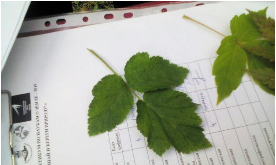
Рис.6. Наш временный гербарий для ботанических изысканий

Конечно, знать особенности листьев поможет нам в дальнейшем научиться пользоваться определителями и находить растения в природе!