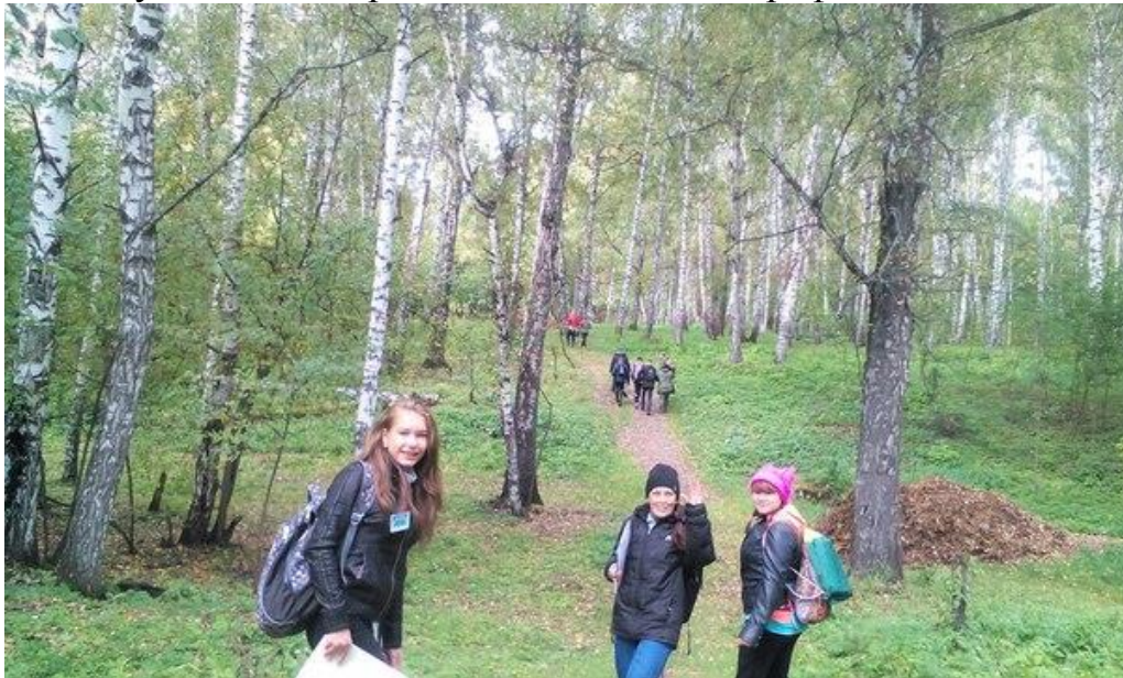
Рис.5 На пути к станции...

Наше путешествие продолжилось на Топографической станции.