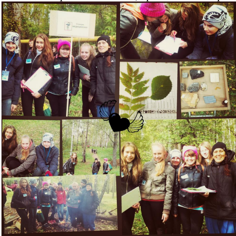
Рис.1 Фотохроника нашей деятельности

Этот день мы провели с улыбкой и отличным настроением. В этом мы выражаем свою благодарность организатором Практикума. Мы счастливы, что смогли участвовать в таком замечательном мероприятии. Благодаря полевому практикуму мы стали дружнее и у нас появилась в школе, зародилась новая команда: «Хранители Земли, хранители Сибири!»